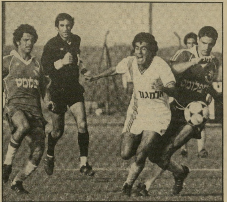
שופט עובדיה בני-יצחק באוויר הטעות האופטית של הטלוויזיה

ואני דוגל בשיטה זו. זה עושה את הכי דורגל ליפה יותר, כשהשופט מתערב כמה שפחות במהלכים במישחק.