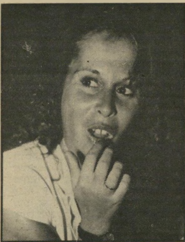
שושי סיני הוכחה מחצת

מסיבת-החתונה, שבה השתתפו 750 מוזי-מנים, התקיימה בבריכת גליח ביד-אליהו. אורח-הכבוד היה צריך להיות, כמובן, שימיעון פרס. אולם הוא היה יכול להגיע. הוא היה צריך לארח את חברי מישלחת מיפלגת-השילטון המצרית, שהגיעו לביי-קור בארץ. תחת זאת שלח הפוליטיקאי מיברק-ברכה. מתנתו לחתונה: ספר הביורי-גראפיה שלו, לך עם האנשים.