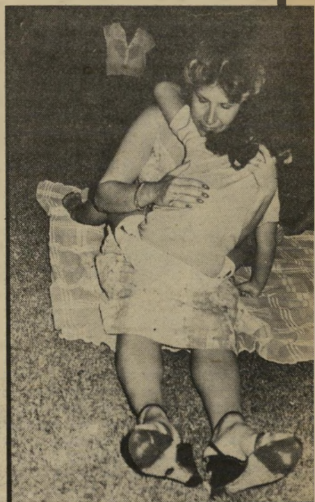
על הדשא אס ובתה חבו- קות אחרי ש- נרדמו, הן סיבבו להתעורר כלייך מהר.

קצת הפתיע אותי הרכב הקהל. ציפיתי לראות שם חברה לבושים בניגודי-כוחנה