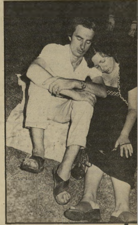
נרדם על הדשא, כתפה על כתפו, כתוצאה מהמדיטציה. אחרי ההתעוררות הם יהיו מאושרים יותר.