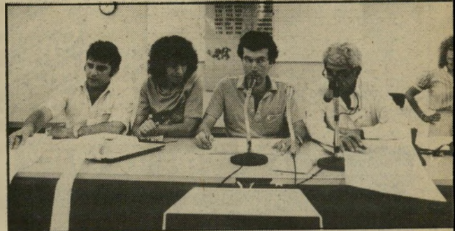
הבורסה בפעולה השערים נמוכים

חוששני כי גובה ההיסל שנש"לם על חוסר מיומנות מדינית זאת, גדול בהרבה מן ההיסל בסך 2%