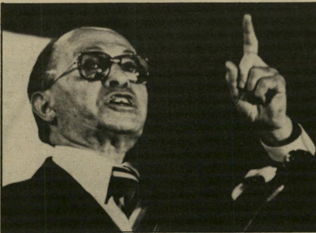
ראש-ממשלה בנין הסנדק