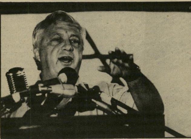
שר-ביטחון שרון אבי המחול