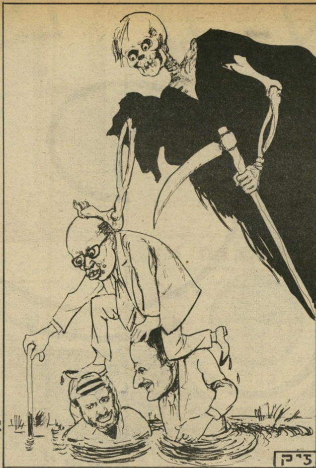
"אצלי כולם שווים!"

במחינה צבאית, קשה מאוד לכ' בוש את עיר-הבירה מבלי שחתי' פוץ "סטלינגראד פלסטינית", כי דבריו של יאסר ערפאת, לוחמי אש"ף בעיר ילחמו עד האיש הר' אחרון, מפני שידעו כי אין להם שום ברירה. אין להם דרך לגסי' גה. מעטים יאמינו לדבריו של שרון, שלא יאונה רע" למי ש' יניח את גישקו. בקרב הלוחמים בעיר, המוראל — כנראה — גבה.