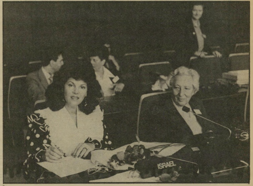
אופירה נבון שחיה בסופיה, בירת בולגריה, בימי המלחמה הראשונים. נבון, נשיאת יוניצף, אירגון האו"ם למען הילד בעולם, בישראל, קיצרה אומנם את ביקורה שם, אך הספיקה לנאום בכנס. בעת נאומה הפריעו לה חברי הממשלה הסובייטית ודרשו ממנה שהיא תתייחס בדבריה לילדי לבנון, שנפגעו בקרבות. בתום ביקורה, כאשר הצלם דויד לוי העביר לרשותה את התמונות שלה, שצולמו באירוע, ניגש אליה חבר הממשלה הסובייטית וביקש לרכוש תמונה שלה למזכרת. נבון, שהיתה מוקפת ב-30 אנשי ביטחון, העניקה לו תמונה זו במתנה.

אבן, שרהתיקשורת מרכזי ציפורי ויצחק ליבני שוחחו על המלחמה בלבנון. ליבני הזכיר את דבר רי הנשיא האמריקאי בנימין פרנקלין, שאמר כי מעולם לא היתה נבמצא מלחמה טובה ולא היה שלום רע. שארף מונטסקייה הצרפתי אמר שאימפריה הנוסדה במלחמה ובחרב תהיי תמיד על החרב. ליבני טען שכפי שזה נראה היום, המלחמה הנוכחית אינה ראשית השלום, אלא תחילתה