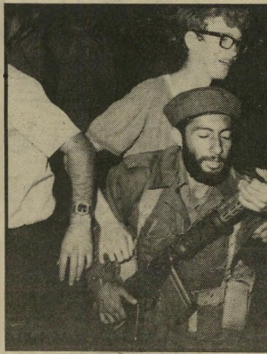
אנשי גוש-אמונים נגד צה"ל כמו נגד השלטון הבריטי

במיקרים אחרים, כאשר חיילים הגיעו לפנות את המתנחלים, כמו לפי אות מסויים, פתחו המתנחלים בנענועי תפי-לה. תמונה אחרת הקשורה ברב לוינגר היתה כאשר בלב השוק הערבי של חבר-רון הוא ניצב עטוף בטלית, שקוע כולו בתורה, בעוד מושלה הצבאי של העיר