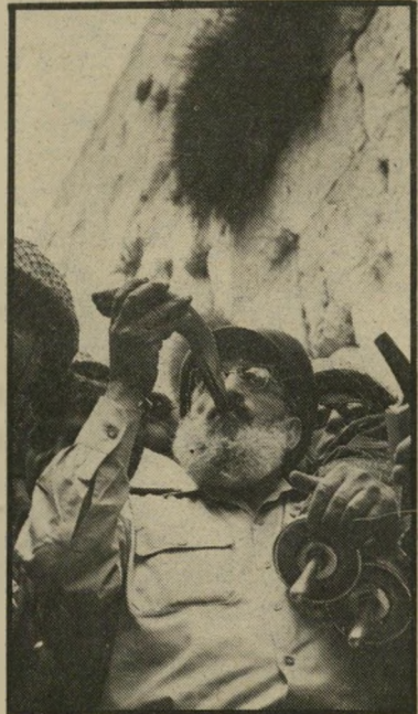
הרב גורן אחרי כיבוש הכותל צוויס קדושים מימי קדם