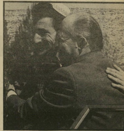
מנחם בגין מחבק את בני קצובר מתנחלים בכל מקום

שרשרת ההפגנות וההתנחלויות נוסח גוש-אמונים, קשורה לקבוצת המתנחלים הראשונה שאותה הנהיג משה לוינגר לחברון עוד בספט' 68, והיא מאפיינת