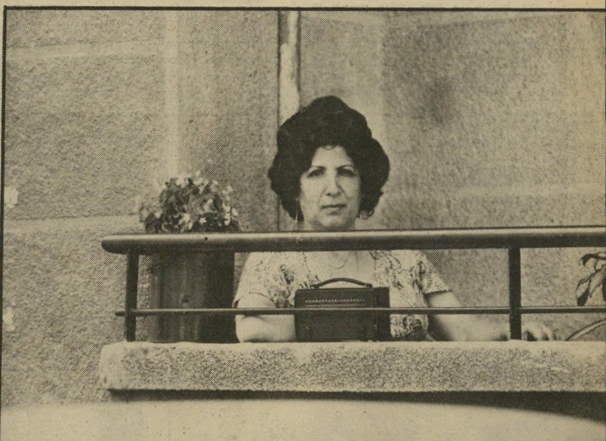
על האירופסת בניירות יושבת אשה מטופחת ומאויינת ל' טרנזיסטור הניצב על המעקה. ל' ידה צמח בעציץ ופרחים, שאף הם נראים מטופחים. היא צולמה בבית ברובע הנוצרי.

השינאה העמוקה לפלסטינים היא נחלת התושבים שפגשנו בהם. הם מרבים לספר על הסבל, שהיה מנת-חלקם בעת שאנשי האירגונים שלטו באיזור. מכאן גם שימחתם, שבמרבית המיקרים נראית כנה באיזור זה, לקראת חיילי צה"ל. הם רואים בהם משחררים. כרגע הם זקוקים להם. אחר-כך, בוודאי, ישמחו להיפטר מהם, כמו מכל צבא זר אחר.