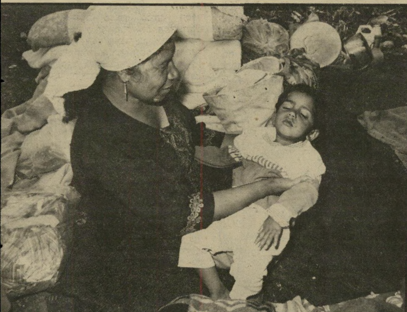
בשדה ליד צור יושבים אשה פלסטינית ובנה. ביחה שבמחנה ה' פליטים ראשדייה נהרס יחד עם כל המיבנים ה' אחרים שם. במחנה זה גרו פליטים מהגליל, עכו, חיפה, יפו ומקומות אחרים בארץ.