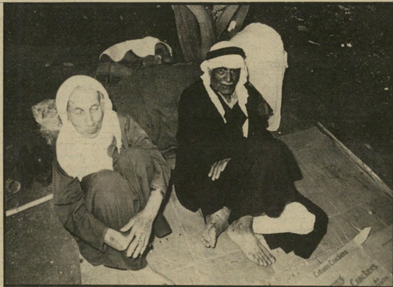
ליד צור שוהה זוג הקשישים שבתמונה. הם יושבים על פיסות קרטון, שפרטו על הריצפה. מאחריהם צרור, שבו נמצא כל רכושם. זהו גורלם של תושבי מחנה הפליטים ראשדייה.

זעם נשקף מעיניהם של ילדי ה' פליטים, שנשארו ללא בית. על יסוריהם אין כליהתיקשורת מדווחים.