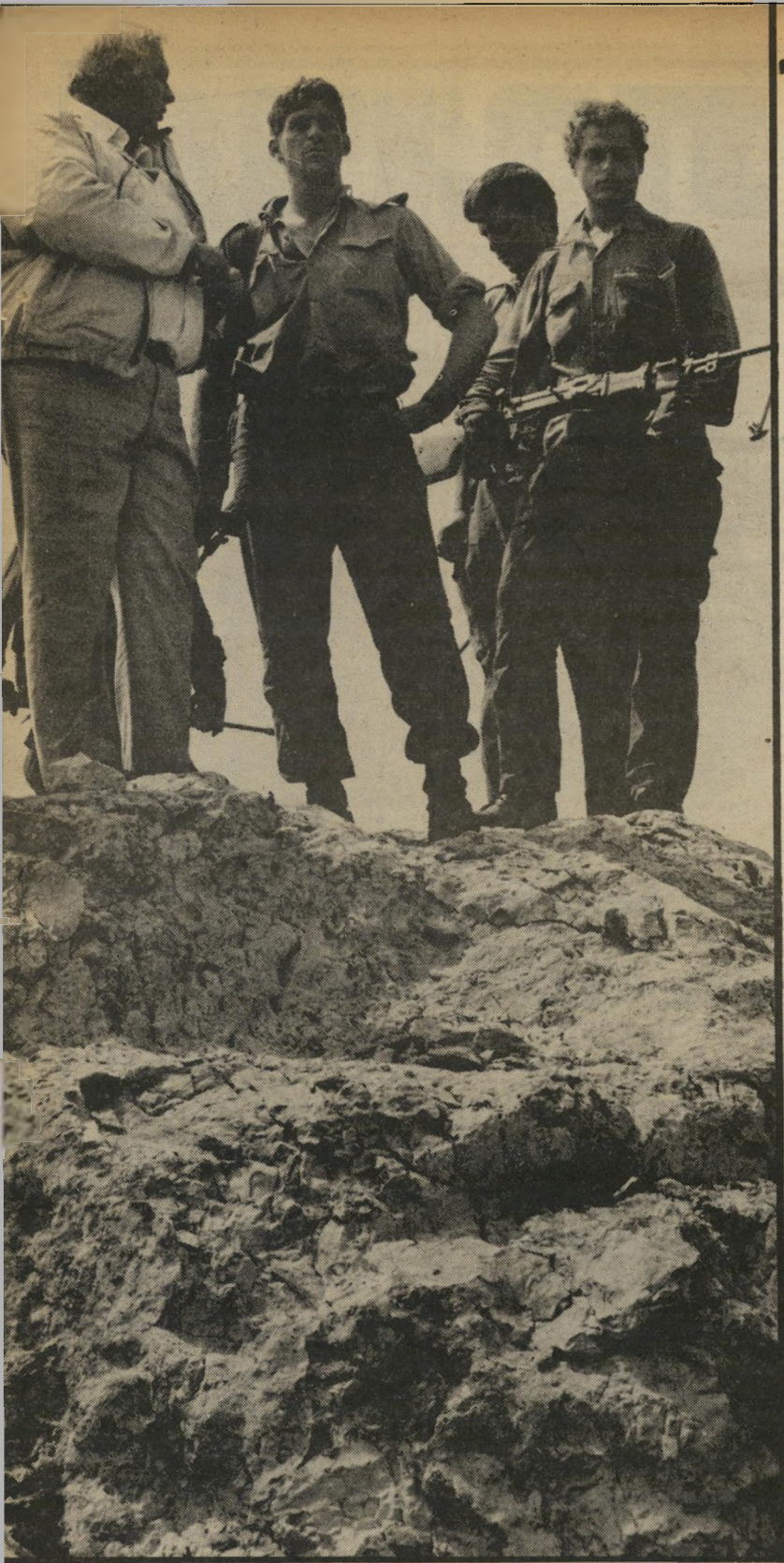
אריאל שרון כבוסטר שלום למען מילחמה

הטלוויזיה הצרפתית שידרה השבוע סרט מהמם, שהוכן עלידי כתב בכיר, שהסגן צילמו של הצלם הוחרמו עלידי שילטונות צה"ל, אך הסיפור שידר היה נורא אף מכל צילום. הוא דיבר על "הפיתרון הסופי" של הבעייה הפלסטינית, תיאר את ההרס השיטתי של עיר גדולה ומפוארת, בית אחרי בית. הוא סיפר כי כל פלסטיני מזהה בכתם שחור על גופו — בדומה לטלאי הצהוב — וכי כל הגברים נלקחים ונעלמים.