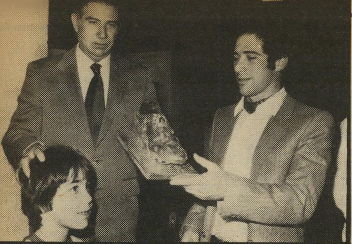
כדורגלן שפיגל ומאמן שפיגל לא יודע מה להגיד

הפועל-חיפה בעונה הקודמת. ש' עומד לצאת בעונה הבאה לשנת חופשה, חוזה: