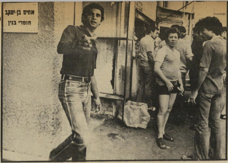
"לא לצלם!" צעקו המשקיעים שהתגנדרו ליד הבורסה, כשעה שבצפון היה נטוש הקרב

ה לצצה הדישה בקרב הלוחמים בלב-נון: בין הלקחים שיסיק צה"ל מה שלישה ללבנון תהיה הצבת קציני-בורסה, שיתלו לכל יחידה שתצא לקרב. תפקידו של הקצין יהיה כפול — הן מסירת עידכון שוטף לחיילים על המתרחש בבורסה, הן קבלת פקודות קנייה ומכירת ניירות-ערך. לא במקרה דובר על כך גם בצפון וגם במקומות אחרים ברחבי הארץ. לא פחות מאשר על הכדאיות ועל המחיר האנושי של המלחמה השישית.