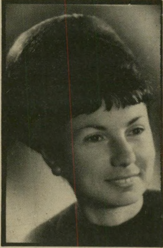
קוראת אלון חוסר יציבות

על המצב הכלכלי ומה ש- צריך לעשות. אני חושבת שיש השתוללות מחירים, חוסר יציבות. השפע וה- כסף הרב שבידי האנשים מבלבלים את הציבור וגורמים לדרישות