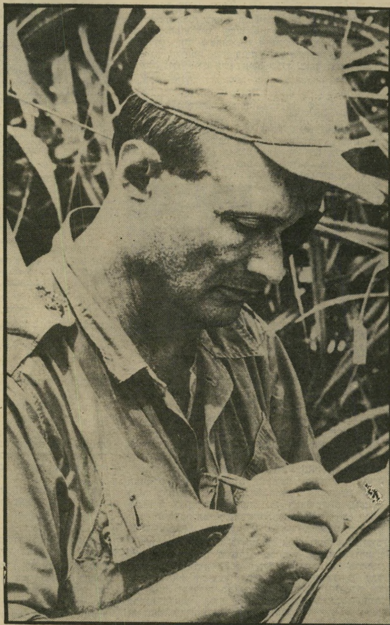
משה דיין כמסעו בוויאט-נאם תשלום כבד

דיין המשפיע, ובאיזו מידה היה המושפע. האם האליל כופה את עצמו על ההמונים, או שההמונים יוצרים את האליל? האם מצליח המנהיג להשחית את המידות של הרפובליקה, או שהוא עולה לצמרת מפני שמידותיה של הרפובליקה כבר הושחתו?