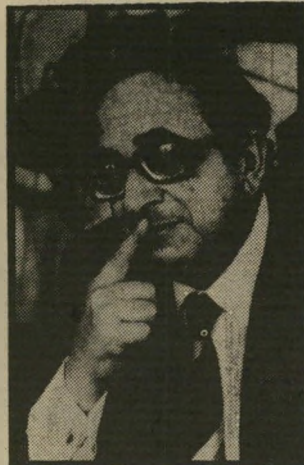
נשיא נבון גבול לחובות

ובדרכך כנשיא פתח תיקוה רי תמרור של שפיות-הדעת מול הי שילטון הבלתי-שפוי המשתולל של בנין ואנשיו, המובילים אותנו אל האסונות והחורבן. כלום אין גבול לחובות סקס הנשיא?