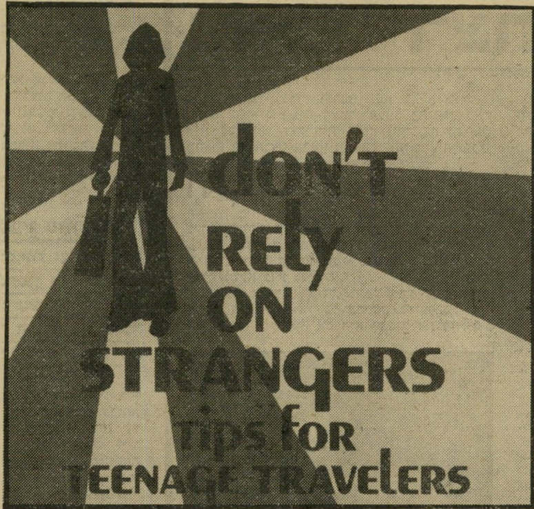
עזן הסברה לנשים, אל תסמוך על זרים — עצות לנוסות בנות-עשרה