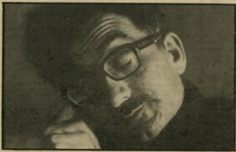
מ. זיב, מוציודג אמיר תוך-שכונתי, תוך-גייל

הגישה הנקוטה בחברה היא, כי האשה תמיד אשמה, כי היא שרצתה והביאה על עצמה את האונס. דעה זו היא הגורמת לקורבנות רגשות-אשמה חסרי בסיס, הסכירו המרכזות. לדעתן רוב האנשים בוחרים את הזמן והמקום שבו יבצע את האונס, והקורבן היא פשוט האשה הראשונה הנקלעת למקום בזמן המתאים. אשה כזו אינה אשמה במה שקרה, אך