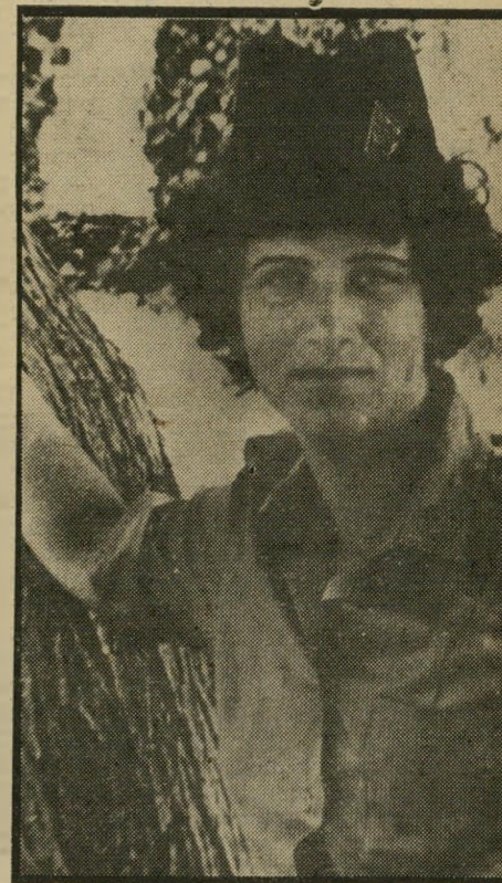
נאנסת-נרצחת וינר נגמר רע

האם יש אונס קלאסי? האם קיימים קווי דמיון בין מיקרה ומיקרה? בדקתי