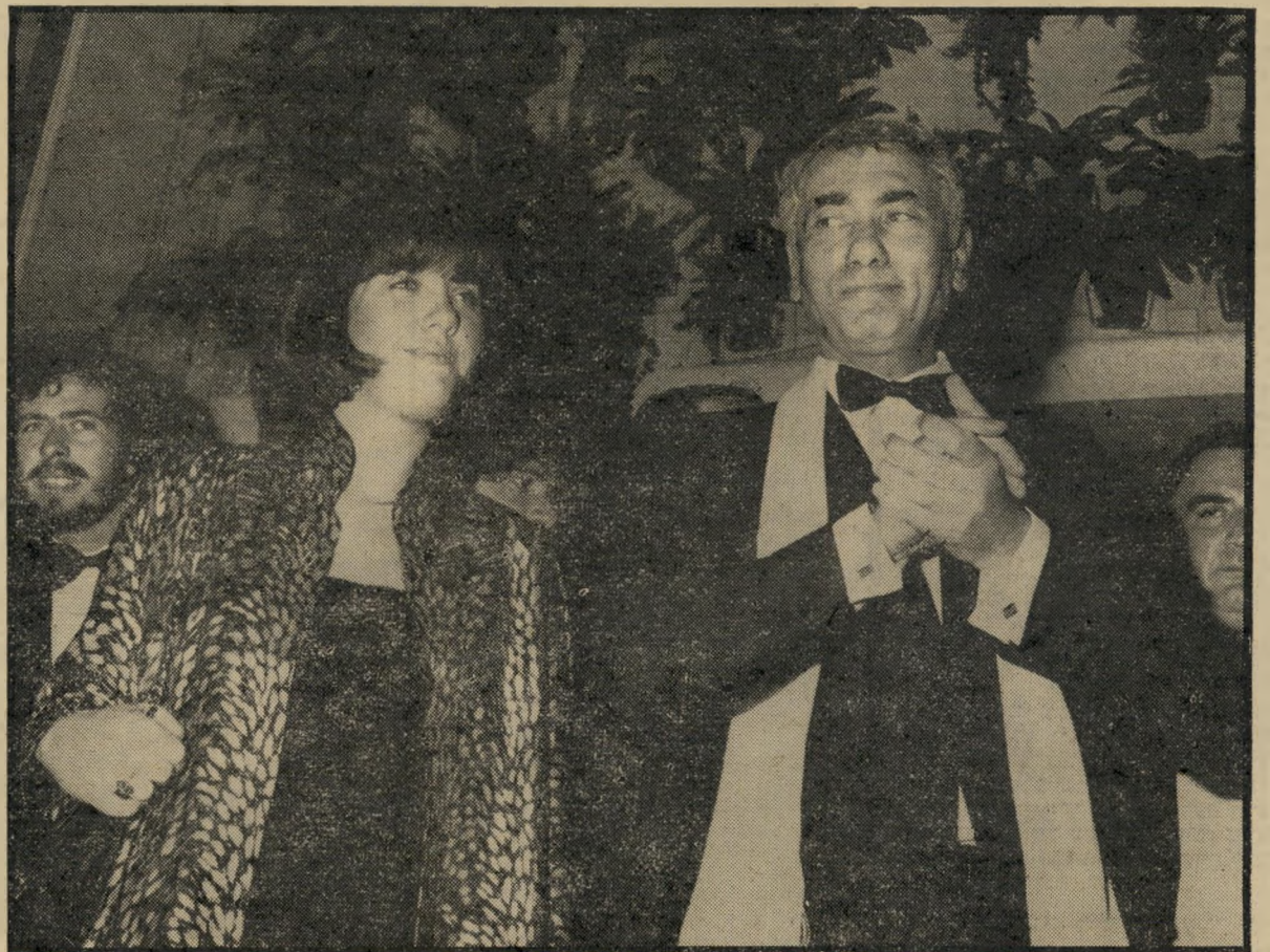
עם הסרט נעדר זכה גם בפרס המבקרים, מממשלת תורכיה ביקשה את הסגרתו. הבימאי שמר את דבר בואו לקאן בסוד עד לרגע האחרון, ובכניסה למסיבת-העיתונאים שלו נערכה בדיקה ביטחונית.