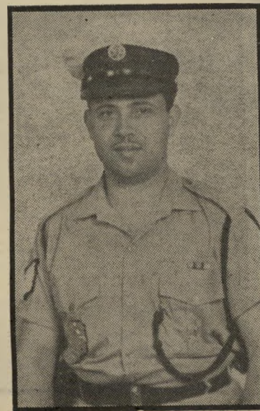
בלש טייב (בשרותו במישטרה) ניקמת השוטרים

טרה, כדי למנוע את התערבותה. לפתע עצר ליד מכונית החוקרים גבר חובש כיפה, ומשך החוצה את היושבים ברכב. הוא פתח בתיגרת-ידיים עם החוקרים, ואחר-כך הוציא מכשיר-קשר והזמין ניידת מישטרתית. החוקרים הסבירו שהם חוקי-רים פרטיים והם באמצע עבודתם, אך