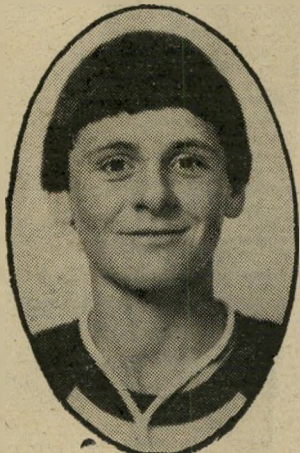
קורא מדרמן פאשיסטיים ומטרופים

גם במדינה משוגעת כשלנו היינו צריכים לשפוש את העיניים, כדי להיווכח שאיננו הווים למראה מה