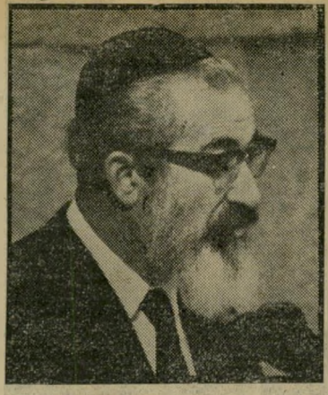
יו"ר לורנץ החוק לא יעבור

איגרות-החוב הצמודות של האוצר מתחרות במניות הבנקים. פיהות השקל לעומת המטבעות של כמה מדינות, עושה אותן להשקעה טובה עוד יותר. מי שהשקיע ב"חודש האחרון באג"ח צמודות, עשה על-פירוב יותר מהבנקים, ומי שהשקיע ב"מט"ח בעיקר בקרנות, עשה עוד יותר טוב. מי שספד לפני שבועיים לדולר התבדה. גם המארק הגרמני היה טוב. היוזרו לעת עתה מהפרנק השווייצרי. הבנקים בשווייץ הפסיקו לשלם ריבית על פיקדונות במטבע זה.