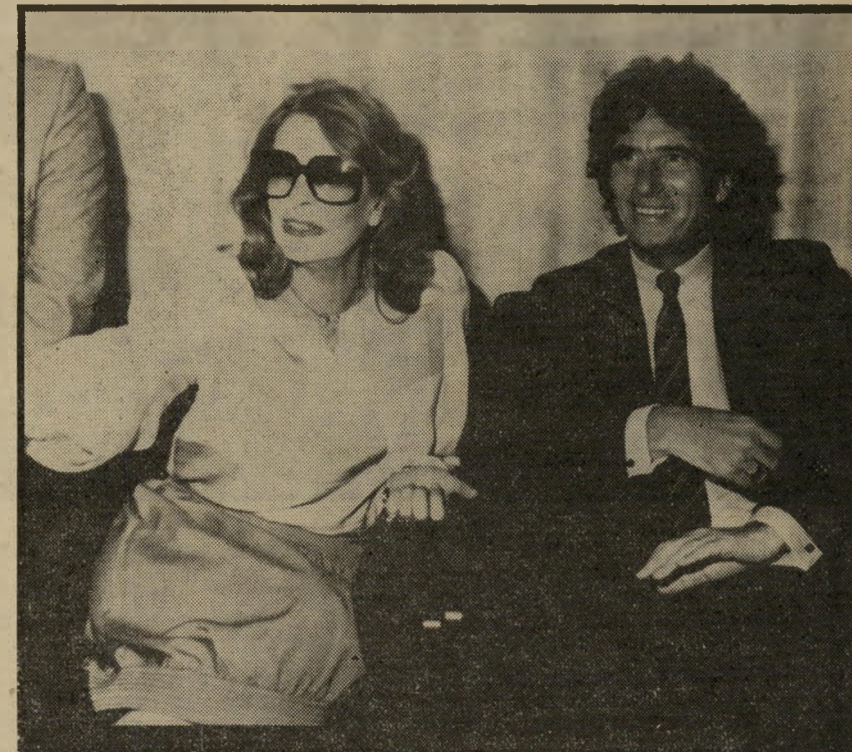
שרי-התרבות לאנג ומרקורי לא כמו זבולון המר

ביום השני של הוועידה כבר נימשטשו הגבולות לגמרי. הערי