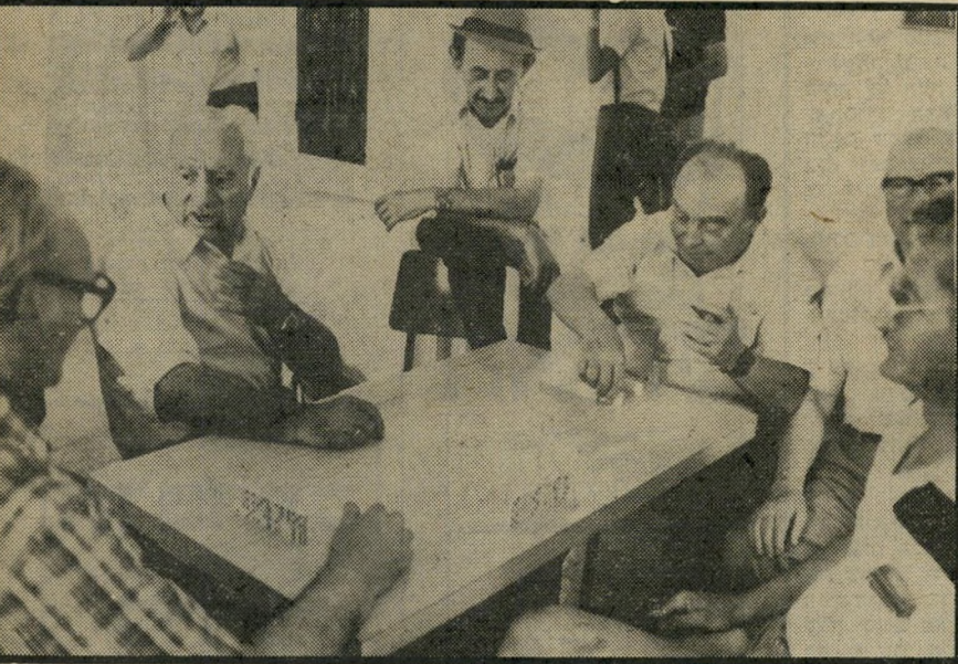
עולי ארגנטינה במישחק-דומינו, האנגלים הם פיראטים!"