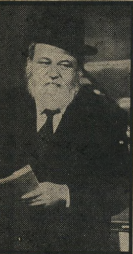
ח"כ שפירא פיקח