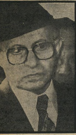
ראש-ממשלה כגון תמים