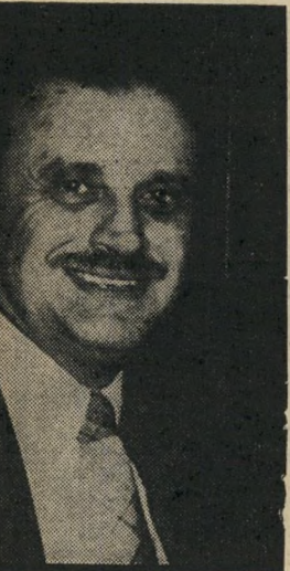
שך שריר טוחר

לא-על יש היום צי של 17 מטוסים, ששניים מהם חכורים, ור אינם שייכים לחברה. שמונה מן בין המטוסים הם מדגם מיושן יחסית, בואינג 707, מטוס מסוג זה, מחירו כשהוא נמכר ביד שניה, נע בין מיליון ומיליון וחצי דולר. לחברה יש גם שמונה מטוסי ענק חדשים יותר, מדגם בואינג 747, מחירו של מטוס כזה יכול לנוע בין 25 מיליון דולר כשהוא נמכר מיד שניה, ובין 47 מיליוני