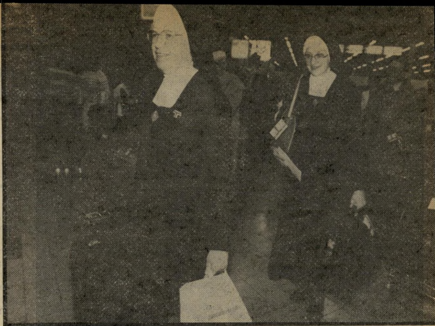
2 נזירות זו תהיה בעיה!

לאומית לטיסות בשבת יהפוך לפתע לדתי? "לא" השיב בחיך לרנר וגילה את ה"סוד": "אשתי נדיבה, עובדת באל-על..." מטוסי אל-על התחילו את טיסותיהם בשבת שעברה מלוד, בטיסה לאילת ב-שעה 5.50 לפנות בוקר.