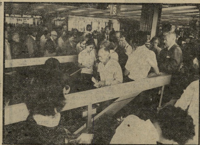
נוסעים ויוצאים לווינה ניצול מושלם של סוף שבוע

ארבע טיסות יצאו לגרמניה בשעות לפני הצהריים: ב-2.10 לשטוטגרט/דיסל-דורף, עם 205 נוסעים; ב-7.30 למינכן, עם 171 נוסעים; ושוב למינכן ב-8.30 עם 175 נוסעים; לפרנקפורט יצאו 262 נוסעים ב-9.40. ב-10.25 המריא הג'מבו של אל-על ל-לינדון עם 296 נוסעים. עם כמה מהם