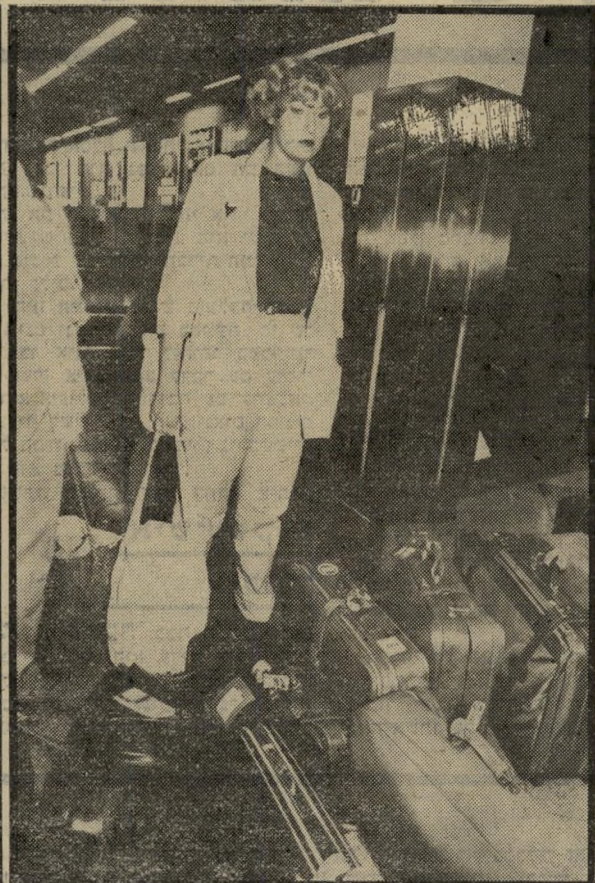
מנהגת קרונר "אנסה לטוס באל-על"