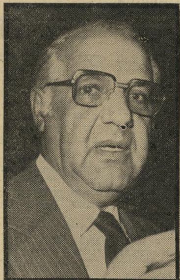
יודי עופר לא אב