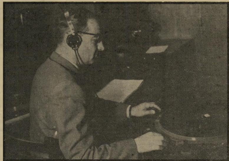
ערב הרצח תצלום של קסטנר כשדבר בקול ישראל, שבו הגיש תוכנית בהונגריה אחי בשעיקבות המישפט נאלץ לפרוש מעבודתו במישרד-המיסדר-והתעשייה. באותה תקופה הוא עבד גם כעיתונאי בעיתון אוי קלט.

"במהלך הכנת הסרטים חיכינו עד ש-השופט העליון חיים כהן, שהיה אז הר יועץ המישפטי, יפרוש מכס-המישפט. כהן, שהגיש את התביעה נגד מלכיאל גרינוואלד היה מבחינתנו אי-שפתח בר פרשה. הוא היה נכון לדבר. בשיחת התחקיר היתה לנו תחושה של אי-שיר תוף פעולה, אבל בזמן הצילום הוא אמר את הכל בצורה גלויה. השופט כהן נטל על עצמו את האחריות ליציאה למערכת. "פרט מעניין שגילינו במהלך התחקיר היה שרוב העיתונות הישראלית זילזלה בחשיבותו של מישפט קסטנר, בעוד ש-