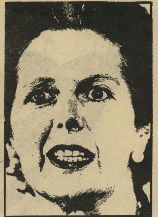
ראשי-ממשלה תאצ'ר צביעות גולדה מאירית

"לכו להודיין". בבריטניה התחילו לשכוח את ארבעת מיליוני המובטלים, ואת המדיניות הכלכלית-