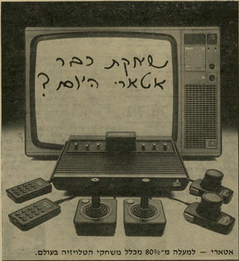
אטארי — למעלה מ-80% מכלל משחקי הטלוויזיה בעולם.