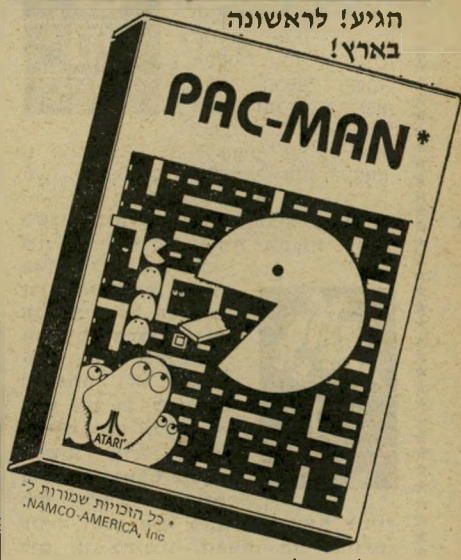
כל הזכויות שמורות ל-NAMCO-AMERICA, Inc.

בלעדי לאטארי — "פאק-מאן" — השדון העגול עם הפה הכל-יכול... היה כדאי לחכות לו! עכשיו גם אתם תוכלו לנסות להכניע את "פאק-מאן" — המשחק שמשגע את העולם!