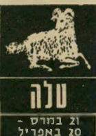
טלה 21 במרץ - 20 באפריל

השבוע תיאלצו להתרכז סביב ענייני ה בית או הדירה. צמיגות תקלות שונות כגון קילקול של אבי זרים השמללים, בעיות או קנייה של אביזרים חשובים לבית; חוסר שקט יורגש כרב ה מישפחה ולא יימצא לכם זמן רב למנוחה. ידידים יפנו אליכם ב בקשות עזרה ואתם, כדרככם, אינכם מסוג לים לסרב לבקשת עזרה. הזמן אינו מתאים ליציאה לטיור לים או לתיכנון חופשה. היו זהירים.