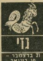
גדי 21 בדצמבר - 19 בינואר

הפופולריות שלכם בעלייה, ידידים חשוך בים לכם יבואו להתארח בבייתכם. הבי קורים יוסיפו לביטחון העצמי ולהרגשה טובה. ובכל זאת, יחכנו אי הבנות ביניכם ובין ה סובבים אתכם. רגישות מופרזת. עלולה להיות הגורם, אתם מסיקים מסקנות מהירות מדי. החצב הכספי משיבי רצון, ותוכלו להרשות לעצמכם לרכוש דברי נוי לקישוט הבית. קשרים עם בני מזל טלה יוסיפו עניין. כדאי לישמוע בעצתם.