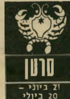
סרטן 21 ביוני - 20 ביולי