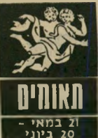
תאומים 21 במאי - 20 ביוני

שינוי טובה יורגש השבוע בכל מה שק שור לכספים. שוב אפשר לחשוב על בנייה של בית חדש או מעבר לעיר אחרת, עקב הח לפת מקום העבודה. נטיעות לחוץ-לארץ עומדות על הפרק וגור מות למצב-רוח הרבה יותר טוב. הפענות מו זרות עומדות לקרות השבוע. יתכן שיגיעו אורחים מחו"ל ללא הודעה מוקדמת. סיר לים שכלל לא התכוננתם להם יתפכו לפ תע לעבודה משמחת. השתלדו בלבול.