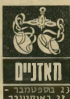
האזניים 23 בספטמבר - 22 באוקטובר