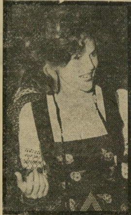
אשת הנשיא נבון דמות ציבורית

האופנאי הביע את דע- תו על לבושה של או- פירה נבון, (מה הם אומרים, „העולם ה- זה“ 2323), ומגיב על המכתבים שהגיעו ל- מערכת בעניין זה.