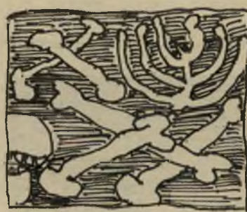
עצמות במירבד הרבה הרבה צלעות

ואז פצחה המשוררת, בקול הדבש והזהב אשר לה, בשיר שחיברה במיוחד לכבוד האירוע, ועיני הקהל זלגו דמעות ונהרה פתאומית עלתה על כל פנים.