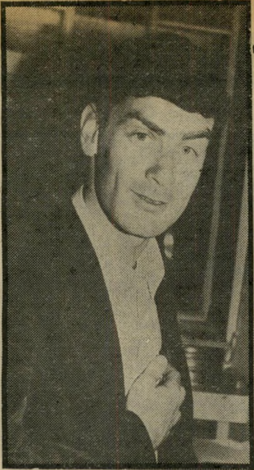
כתב-מועמד גוט "אל תגעו באשתי!"

סרטוני תחזית-מוגה-האוויר של חזית-שירתו את הפוליטיקאים והפכו תחזית-מדינית. את התמונות שתיארו את צפון-סיני "האופירה" המירו תמונות המתארות