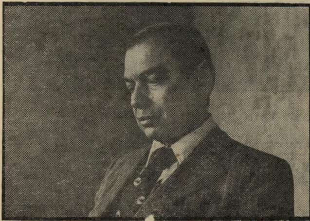
פרופסור שראכי, העם הפלסטיני פותח את זרועותיו...

העם הפלסטיני פותח את זרועותיו על ישראלים העומדים לצידו במאבקו להגשמת השלום והדור-קיום בארץ. המאבק הוא אחד, ו-הגורל הוא אחד!