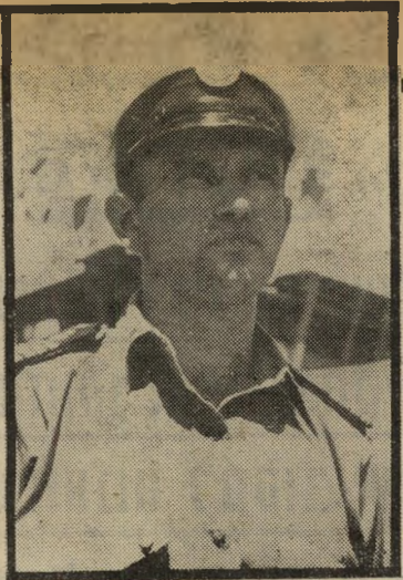
אדוף שמיר יותר מאמץ, יותר קרבנות

ב־גוריון, אך הוא לא הצליח להטיף עות את הרמטכ"ל בפועל, ייגאל ירון, שירע היטב מיהו האחראי ל־ כישלון זה במפרון.