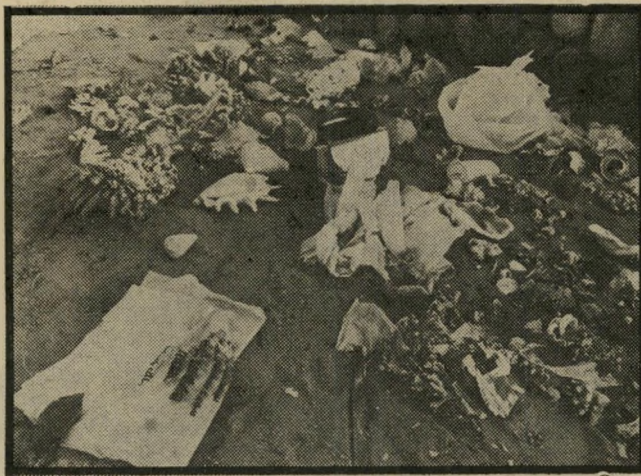
החורף באופירה זיהם, הרס ונסוג

צוגיים ברורים: התארגנות של קבוצות צעירים חסרי סיפוק ותע" סיקה.