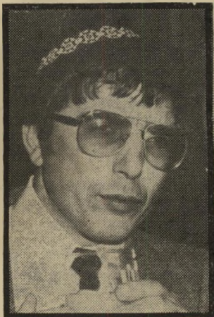
שר-לשעבר אבן-הצירא ירושה מכאן

זכאן אני, האזרח, חייב לשאול אתכם כמה שאלות. האם אתם, העם בישראל, האם