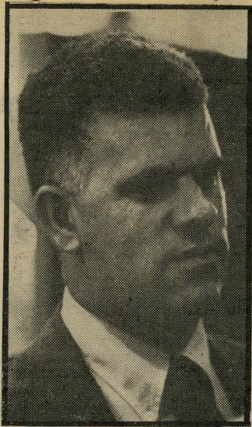
נגיד-בנק מנדלבאום הצמודים עלו כפול

חוץ מרמזים עכים, יש לבנקי-ישראל שיטה נוספת. אם הבנקים נותנים תשואה של 5%—6%, יכול בנקי-ישראל להציע תשואה של 9%—11% לצמודים שלו. הוא לא רק יכול, הוא גם עשה זאת החזי-רש. ועכשיו, אומרים בבנקי-ישראל, מי שענינו בראשו יתכבד ויזנת את מניות הבנקים ויעבור לצמודים. למה, שואלים, לא ינגוס הבנק בחלק ממניות הבנקים, למה לא יגווח חלק מהמיליארדים במר-תפי בבנקי-ישראל? אלא החוששים למניות הבנקים, אומ-רים בבנקי-ישראל, שהקוץ מעט מן המיל-יארדים טובה לבריאות, מה גם שתישמר רמה ריאלית מוסימת, בהחלט לא מה שהיה בשנה שעברה.