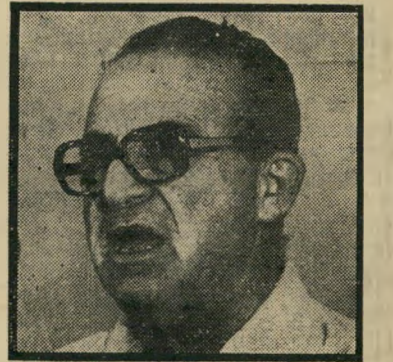
ארק (מיל') זורע צריך סוכנים?

ייתקרו בינתיים. גם לא תעריפוי הטיפות, למי שיטום לפני יוני. הדולר חגג בשבוע שעבר את פריצת מחסום 20 השקל, אבל זה בוודאי לא יפריע לרבע מיליון ישראלים לטוס הקיץ לחו"ל.