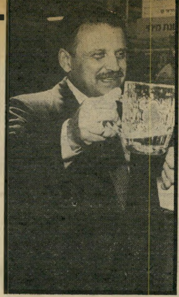
שריית יירות שריר כמה יסעו לחו"ל

שר עסוק. בעיקר בנסיעות ובהצהרות. שהאחרונה בהן: חרפה. כלימה, בושה וזעם אווזים בו ולא מרפים ממנו על