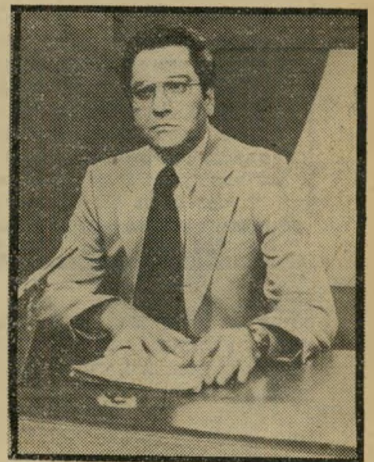
עורך אחימאיר אומץ עיתונאי

הסיום המהמם של מוקד, שבו הוכא דיווחים מפינוי ימית, על אפס ועל חמתם של ח"כ מילוא ושל היועץ פורת, שבו