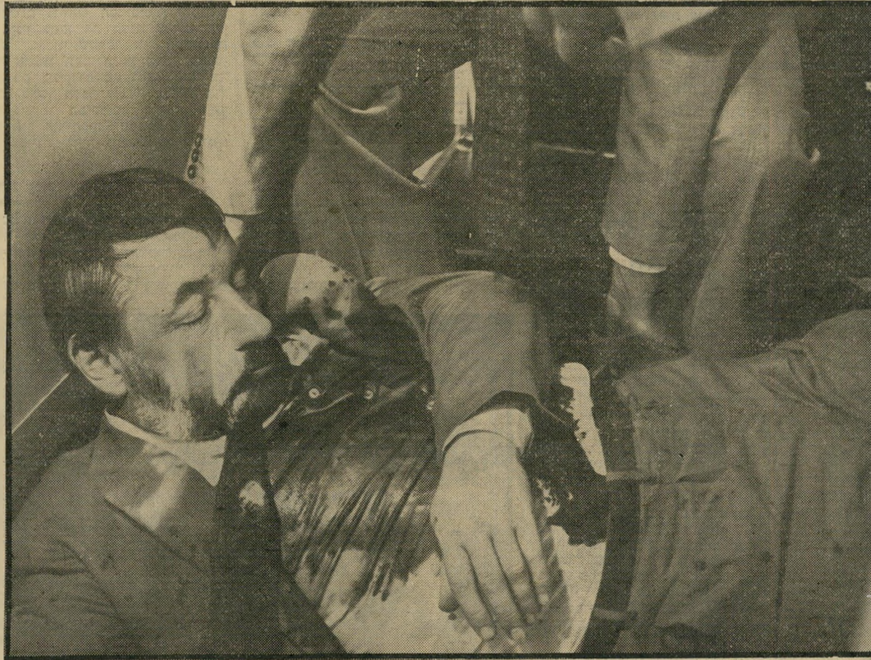
פיליפ נוארה בתפקיד האח הבכור, רואה עצמו כפינט אחרי שנורה בידי טרוריסטים אנטי-הרוח מתלבטים עדיין

שלושה אחים מלא במעמדים מן הסוג השני, בעיקר כאלה שבהם מעורב אבי שלושת האחים, השחקן הצרפתי הישיש והנפלא שארל ואנל, והילדה המגלמת את נכדתו. החצר השטופה באור בהיר וחסר רחמים של שמש ים-תיכונית, צללים בהי רים ומודגשים חליפות, ספסל שעליו יושב הישיש וכלבו המשתכשך על ידו. "באמצעות הסיפור על שלושת האחים האלה, השתדלתי לדבר על החיים, המוות, הערכים העתיקים והנצחיים שבתוכנו, ור האלימות שמאיימת עליהם", מסביר רוזי. מול המהומה והקריעה הנפשית של החיים המודרניים, יש יופי, כוח ושלמות כה רבים בתמונה הפאסטורלית הזאת, יש בה כל כך הרבה אהבת אדם וכמיהה לשלווה ולשקט, שקשה מאוד לא להדהות עמן. במיוחד למי שחי בסביבה רוגשת, רועשת, וחסרת מנוחה, של שנות ה-80.