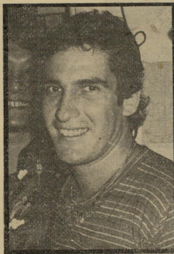
ישראל בויקו קצב מטורף

רזרוה, שעמיה הוא מסתובב, כששתי ה-אחרות נחות מן הקצב המטורף שהוא מכותיב להן. זהותה של הבחורה הזאת היא פצצה רכילותית של ממש. מכל מיני סיבות נורא-נורא חשובות, החלטתי לעת עתה שלא לגלות לכם מי זאת. אבל תהיו בכוננות, כי יכול להיות שפשוט לא אוכל להתאפק.