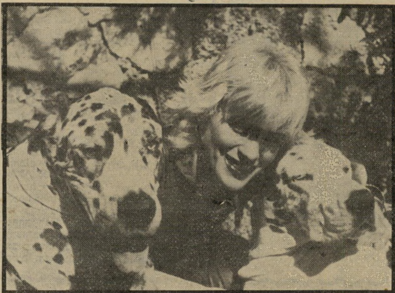
ציפורת כרמיה וידידים שיגעון רדיפה