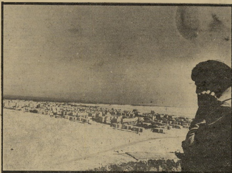
ילדי אופירה יום לפני הפינוי: תקציב הביטחון השנה הוא חמישית מהסכום שבוזבז

אוצר נוהג לומר, הדבר המונע עצמאות כלכלית של ישראל.