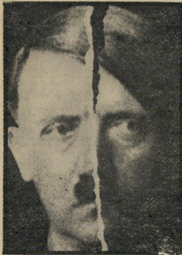
משמיד-עם היטלר "קיבלו טיפול מיוחד"

בימים אלה, כאשר חיילים ישראלים מנסים לכפות על דרוזים ברמת-הגולן תעודות-זהות ישראליות, וראשי-ערים יהודיים מוצבים על ערים פלסטיניות בגדה המערבית, ונעשים ניסיונות להקמת יודנ"ה