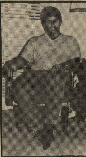
קורא צבר מסטיק קינמון

ושותה רק מיץ שורשי סלרי ולר עם מסטיק בטעם קינמון.