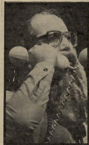
אישיות צפיר היה עדיף

טענתי היא שלפנינו לא מיקרה של שרלטניות, אלא ביטוי לקו רעיוני של תנועה זו. קו מאפיין של התנועה, מראשיתה, היה ה-