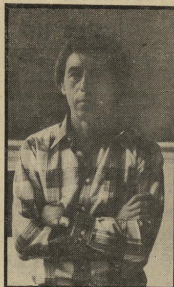
פרופסור בן ט' צין

האמריקאית. האחים נקש התחילו את ה-קאריירה המצלחה שלהם עם כיסים ריקים. משמותיהם הפרטיים יצרו שילוב שנתן את השם ג'ורדש. בתוך 18 חוד-