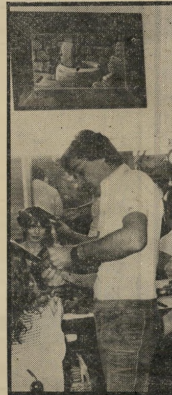
ספר בטיטו ויצירתו גנועוים ועצב

את מיקצוע הספרות למדתי בגיל 18, אבל לצייר ידעתי עוד