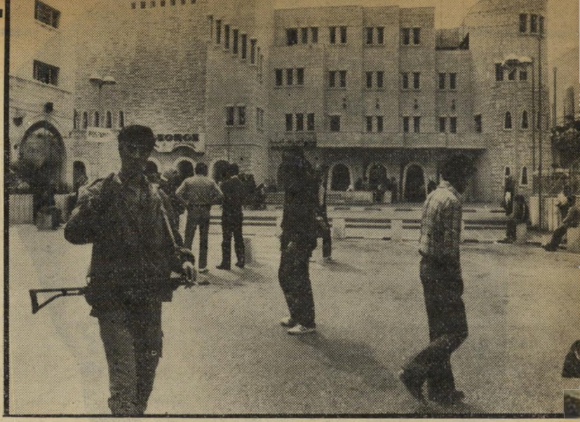
„אסור לצלם!“ הודיע איש מישמר-הגבול (משמאל), שפיטרל ב־ רחבה לפני עיריית בית-לחם. הוא פנה לצלם, ודרש להוציא את הפילם ממצלמתו. רק אחרי הסברים ושידולים נמלך בדעתו.