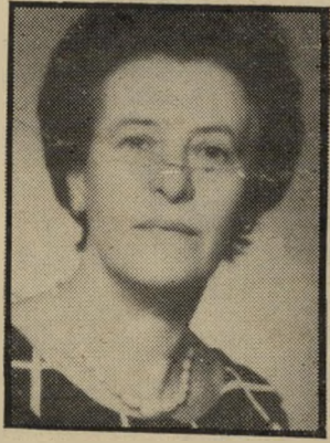
קוראת גורדנברג רצון הבוחר

צבי מרוב, רמת השרון עורש הבטייה הקוראת מתפעלת מתוכי-נית טלוויזיה.