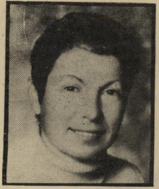
קוראת אדון פתרונות ממשיים