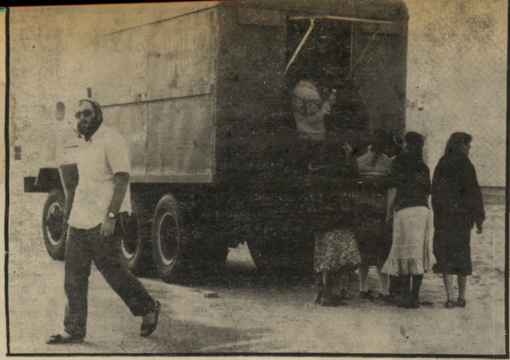
צה"ל מאכיל את מתנגדיו. מול הרובע הדרומי של העיר, שבו התבצרו מתנגדי הנסיגה, נעצרה קנטרינה ניידת של השק"ס. בחורי ישיבה ובחורות מתנגדי הפינוי עורכים קניות באשנב השק"ס המיועד לחיילי צה"ל, ולא למתנגדיהם. זה עוד אבסוד של ההצגה הגדולה בימית.

ב יום החמישי האחרון הורם המסך מעל המערכה המשע"שעת ביותר עד כה. ההכנות לקטע זה התחילו עוד בשעות הבוקר. עשרות צלמי טלוויזיה ורים, עיתור נאים מכל קצוות-הבול, תפסו הרא"שונים את מקומותיהם ביצע ש"בחולות שפת-הים של ימית. היה זה יום שרב קשה ורוב הצופים פשטו את חולצותיהם. העיתור נאיות נשארו בביקני. בזמן ה"המתנה הומונו בקבוקי בירה. נערי כה אפילו תהרות ש-ש"ש. הבימאים המוכשרים הפגינו ב"צורה משכנעת את האימרה הידו"עה, כי כל אירוע היסטורי חוזר פעמיים — בפעם הראשונה כי טרגדיה, בפעם השנייה כפארסה. הדראמה הידועה של הספינה אלטלנה, שנתלקחה מול חופי תל"אביב אחרי שנוורו עליה פנוי "התותח הקדוש", עובדה לגירסה קלילה. סירת-דייגים קטנה, שהסבה ל-