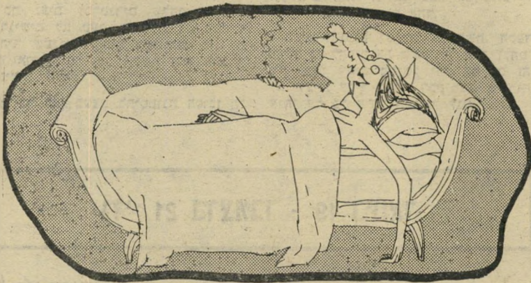
„זה היה נהדר, מותק! אתה באמת יודע להאזין לסיפורים!“

לבני המאזניים צורך חזק לארגן ולשר לוט באחרים. לבני-אדם חברותיים כמוהם, קל מאוד להפנות תכונה זו לעבר חדר-המיטות. הם שונאים כל מי שמתנגד להם, וחבריהם הם אלה הסרים במהירות הגדולה ביותר למרותם. בן המאזניים יבחר לעצמו את השותף למיטה, יחליט כיצד יתנהלו הדברים — ואוי למי שיעז להמרות את פיו.