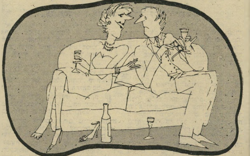
„אני תמיד לוכשת תחתונים נקיים, למיקרה שאישיכתוהה ידרום אותי!“

שה למצוא מישהו סהור וזן דיו, שיצליח לפתות את הבתולות. אולי הבתולה הקדושה. אבל מי שיצליח, יוכל ליהנות משני העולמות, מכיוון שבני בתו לה, למרות שהם נראים כל-כך מתוחים ועצורים, תרמו תרומה נכבדה לקהילת ההומוסקסואלים.